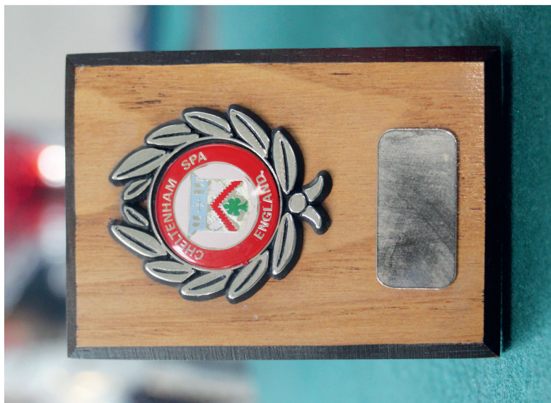
Рис. 2. Плакета «Герб города Челтенхема» – подарок мэра г. Челтенхэм М. Стаффорда, 1988 г.