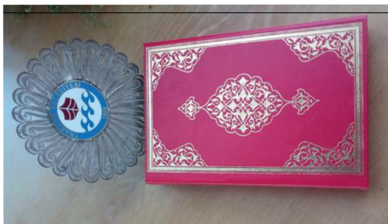
Рис. 1. Герб города Трабзон и подарочное издание Корана – подарки мэра г. Трабзон Айсым Айкан, 1992 г.