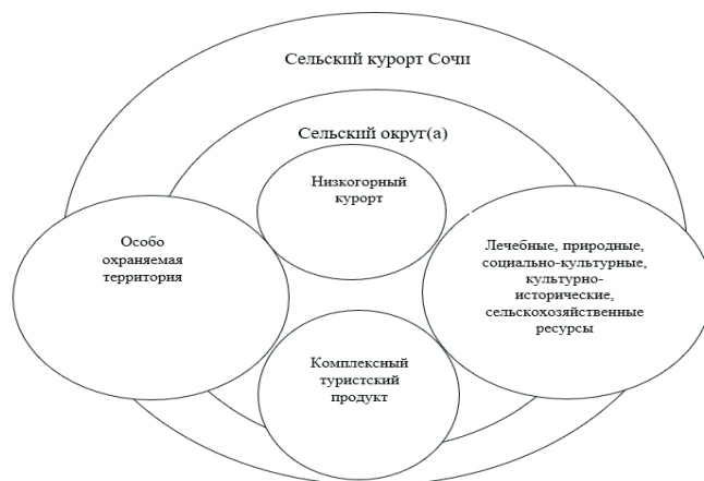
Рис. 1. Основные элементы сельских курортов Сочи

В городе-курорте Сочи Краснодарского края в соответствии с административно-территориальным делением законодательно закреплено 12 сельских, в т. ч. один поселковый округ и 79 сельских населённых пунктов. Из них возможно создание до 28 сельских курортов различного статуса, на основании стратегии комплексного развития и генерального плана города Сочи, а также решений федеральных, региональных и муниципальных органов власти по определению статуса сельского курорта Сочи в соответствии с действующим законодательством РФ [2–8, 11–13, 15–17, 19–25, 27–30]. Основные элементы сельских курортов Сочи показаны на рисунке 1.