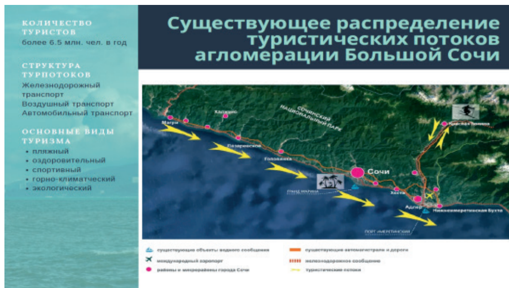
Рис. 3. Распределение туристских потоков агломерации Большой Сочи (город-курорт Сочи) [7]